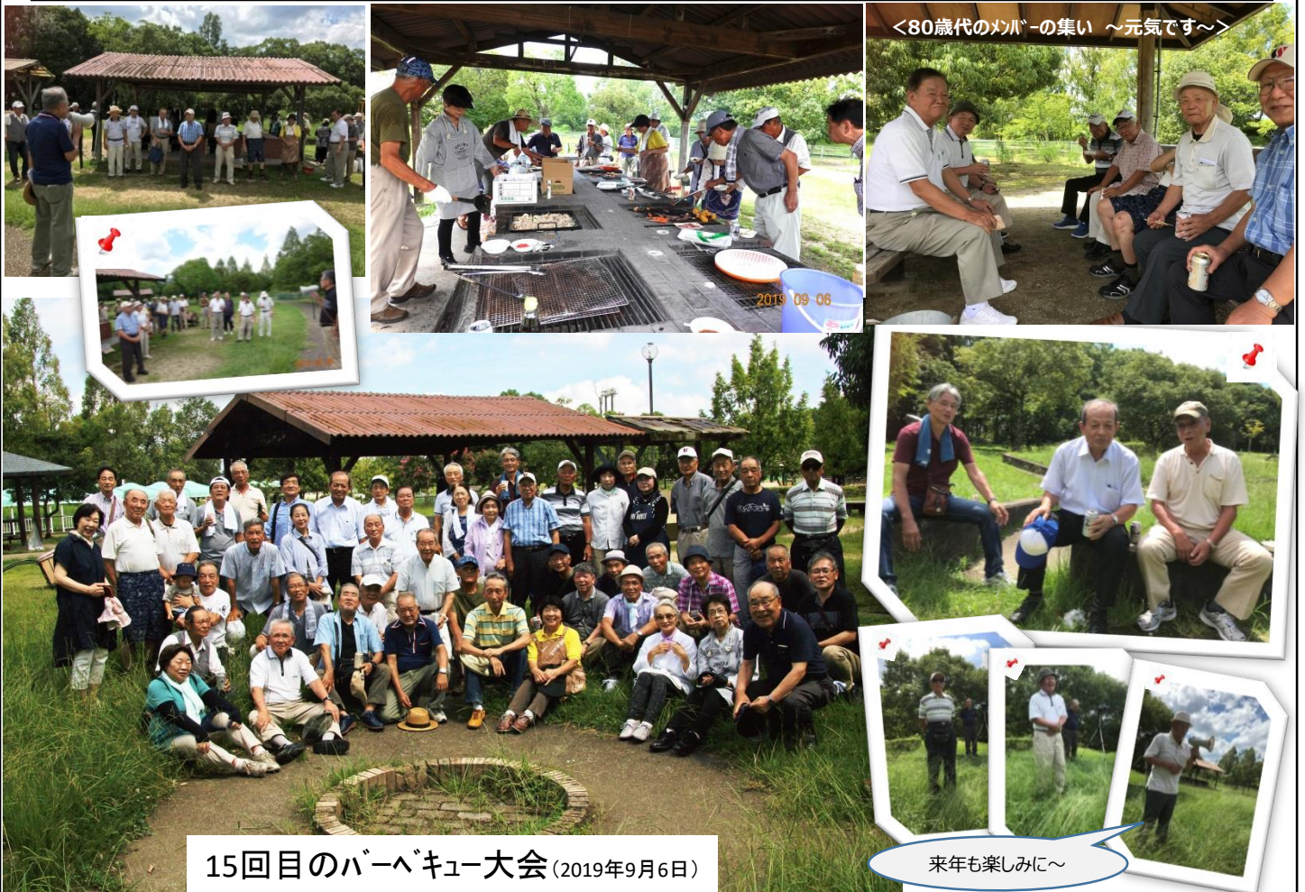
15回目のバーベキュー大会 (2019年9月6日)

平成24年に定年退職後、3人の子供たちの結婚と孫の誕生、同居していた義母の看護と看取り等々であったという間に7年が経過しました。本年9月付で洋友会入会させて頂きました。入会早々に役員の方からバーベキュー大会への誘いを頂き、家内と孫を連れて参加しました。退職後7年も経っており参加されている方々の事を覚えているか多少不安を抱えたままでしたが、皆さん方と色々とお話をした途端に殆どの方の名前や当時の出来事を自然に思い出しました。皆さんと懐かしい話、冷えた飲物と美味しいバーベキュー、特製焼きそば？、甘く冷えたスイカ等で家族ともども至福の時間を過ごさせて頂きました。私だけでなく家内や孫まで優しく気さくに声をかけて頂き、温かく迎えてくださった皆さんの心遣いがとても嬉しく、洋友会へ入会して良かったと改めて感じました。今後は時間の許す限り行事に参加すると共に、積極的にお手伝いをさせて頂きたいと考えていますのでよろしく申し上げます。残暑厳しい中、バーベキュー大会の準備・運営等にご尽力頂いた役員及び幹事の方々に感謝申し上げますと共に、今後の洋友会滋賀地区の益々の発展と皆様のご健康を願っています。