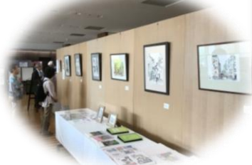
令和元年8月 於：刈パル京都