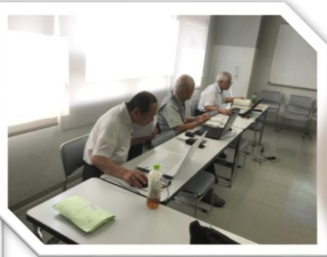
悪戦苦闘しながらも真剣に楽しく 取組んでいます