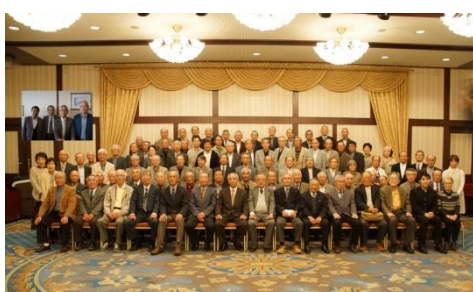
平成30年懇親会集合写真