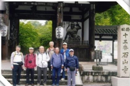
平成30年5月9日 〈瀬田川散策〉