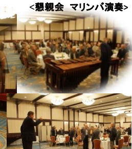
懇親会(乾杯ご発声)