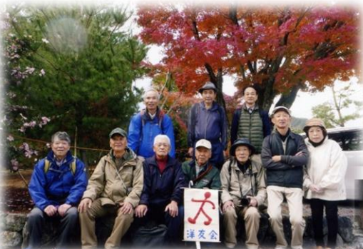
平成30年11月22日 〈京都嵐山周辺へ〉