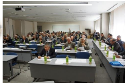
平成30年洋友会 総会

仲間とお会いし、語り合 い、友好を深め合う絶好 の機会でもありますので お誘いあわせの上多くの 方にお越しいただきます よう、役員一同お待ちし ております。