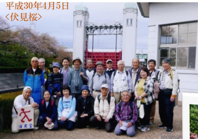
平成30年4月5日 〈伏見桜〉

(5月) 滋賀石山寺&瀬田川沿いの春を楽しみました。京都伏見稲荷散策。台風一過の傷跡の残る千本鳥居とお山めぐりを楽しみました。 (10月) 京都嵐山散策。紅葉真つただ中の嵯峨嵐山周辺を散策しました。途中、清涼寺・天龍寺境内で自由行動し、各々ゆつくりと紅葉を楽しみむことが出来ました。 最近の状況として、京都伏見稲荷や嵐山周辺は海外からの旅行者が年々多くなつてきており、日本人より海外旅行者の数が多いうるに感じます。 さて、残りの1回は年明けの3月上旬に大阪城周辺ウオーキングを計画しております。ウオーキングは、日頃出会う機会の少ない会員の皆様方の憩いの場として活用いただけます。また、体力向上&維持は難しい年齢？この際に体力下降のスピードを減速する手段として、皆様のご参加を心よりお待ちしております。