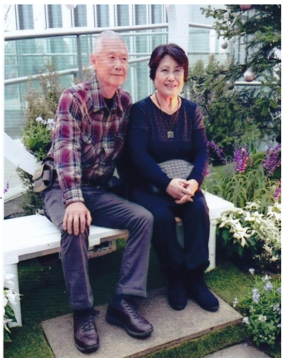
(H28年11月淡路夢舞台にて)

現在72歳。年若くして結婚したため、この歳で結婚50年とは感慨深いものがある。姫路から上阪し会社の寮に入っ